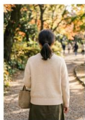
親戚に似た女性が少し遠い前を歩いていました。

まだ暗くない夕方、摂津富田駅から家まで歩いていたら、阪急電車の踏切の前で、近くの遠縁によく似た女性が前を歩いていました。何となく気にしながら踏切を渡った途端、体が思うように動かなくなりました。