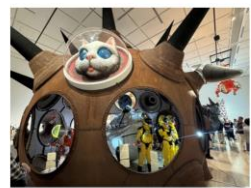
現代アートはテーマは単純?表現は難解!?