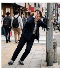
踏切を渡った途端、急にクラクラして、まっすぐ歩けなくなりました。イメージ図

踏切を渡る前までは、何もなくて、機嫌良く歩いていたのに、突然、めまいのような、なんとも言えない状態になりました。とにかく帰宅しようと、歩き出しても、クラクラするし、左へ引っ張られるような状態で、まっすぐ歩けなくなりました。