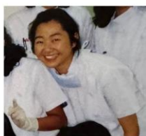
多分、5年生くらい 病院実習の頃かな

まだ暗くない夕方、摂津富田駅から家まで歩いていたら、阪急電車の踏切の前で、近くの遠縁によく似た女性が前を歩いていました。何となく気にしながら踏切を渡った途端、体が思うように動かなくなりました。