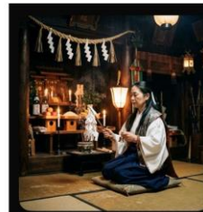
霊媒師のイメージ AIさん作