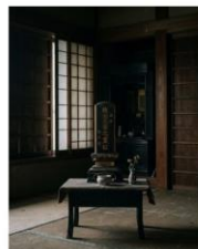
AIさん作イメージ図

後から考えると、踏切のところで見た女性は、亡くなった遠縁(血のつながりはなかったのですが、親戚のようにお付き合いのあった人でした。)の後ろ姿にとってもよく似ていたのです。しかも、その人の家は踏切を渡ってすぐ、左の道を行きます。私は右の道を。その先を右折するので、右側を歩く習慣がありました。左体を持っていかれる強い力は彼女が家によんでいたのではなかったかと、気になり、亡くなった後のことを聞いてもらいました。すると、やはり無人になった家にポツンとお位牌だけ置かれていて、誰も何もしていなかったそうです。