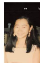
トレンドドラマに感化されすぎ。。