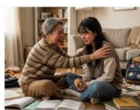
患者さんに貴子吃られる 大学2年生(多分)の夏休み