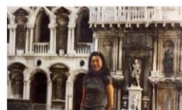
香気に遊んでた頃のこと、